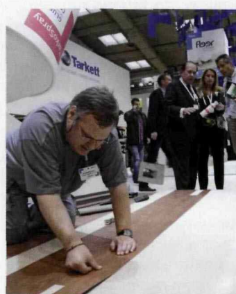
TARGI „DOMOTEX” SĄ IDEALNYM MIEJSCEM DO POZNANIA TAJNIKÓW WŁAŚCIWEJ INSTALACJI RÓŻNEGO RODZAJU PODŁÓG.