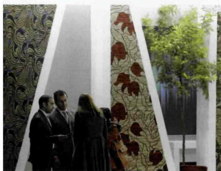
CO ROKU WYSTAWCY, UCZESTNICZĄCY W HANOWERSKIEJ IMPREZIE, ZASKAKUJĄ ZWIEDZAJĄCYCH NIE TYLKO PROPONOWANYMI WZORAMI OKŁADZIN PODŁOGOWYCH, ALE TAKŻE SPOSOBEM ICH EKSPONOWANIA.