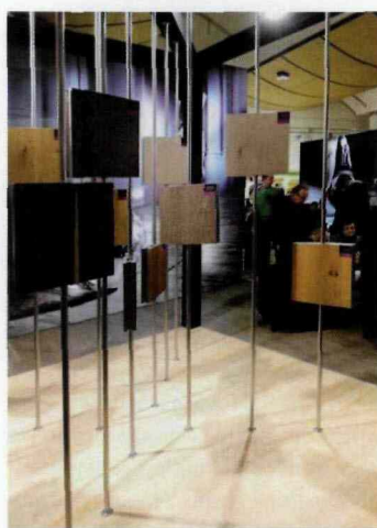
PRZYGOTOWANE PRZEZ FIRMĘ BALTIC WOOD NOWOCZESNE I OTWARTE W FORMIE STOISKO PRZYCIĄGAŁO ZWIEDZAJĄCYCH SPECJALNIE ZORGANIZOWANĄ STREFĄ Z PRODUKTAMI WYKONANYMI Z DĘBU.