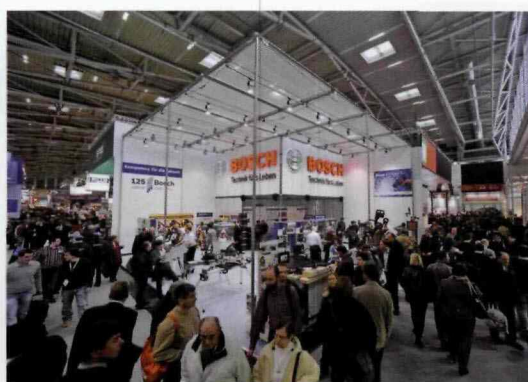
NOWOŚCI PRODUKTOWE, ALE TAKŻE ROZWIĄZANIA DOBRZE ZNANE POLSKIM WYKONAWCOM, MOŻNA BYŁO ZOBACZYĆ NA STOSIKU FIRMY BOSCH. [Fot. Messe Muenchen].