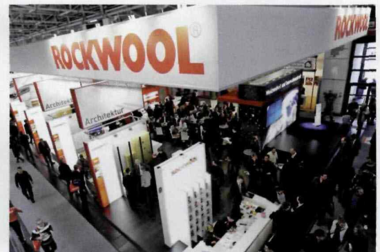
NOWOŚCI, KTÓRE PREZENTOWANE BYŁY NA STOISKU FIRMY ROCKWOOL, DEDYKOWANE BYŁY PRZEDĘ WSZYSTKIM RYNKOWI NIEMIECKIEMU. NALEŻY MIEĆ NADZIEJĘ, ŻE INNOWACYJNE ROZWIĄZANIA NIEDŁUGO TRAFIĄ RÓWNIEŻ NA RYNEK POLSKI.