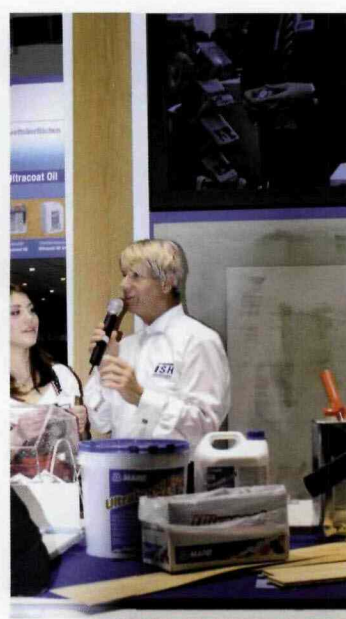
DUŻYM ZAINTERESOWANIEM ZWIEDZAJĄCYCH CIESZYŁY SIĘ LICZNE POKAZY PRZEWODZANE NA STOISKACH WYSTAWIAJĄCYCH SIĘ FIRM.

rock UD – płyty termoizolacyjne z wełny mineralnej i płyt g-k do izolacji termicznej od wewnątrz, np. obiektów zabytkowych oraz Georock 037 – wodoodporne i paroprzepuszczalne płyty do izolacji zewnętrznej dachu i stropu.