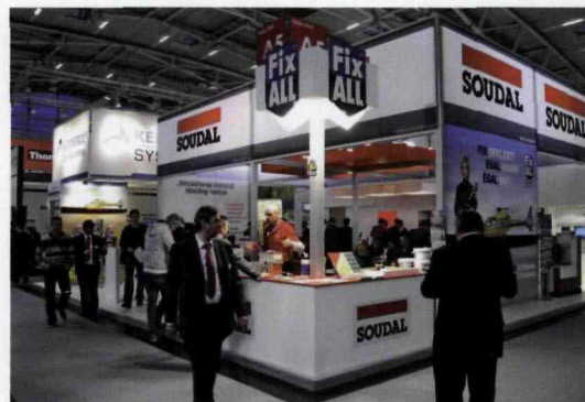
TEGOROCZNA OFERTA TARGOWA SOUDAL PODPORZĄDKOWANA ZOSTAŁA PREZENTACJI ROZWIĄZAŃ SYSTEMU SWS, STANOWIĄCEGO ZESTAW PRODUKTÓW DO PROFESJONALNEGO MONTAŻU STOLARKI OKIENNEJ, ORAZ NAJNOWSZYCH PRODUKTÓW DO USZCZELNIANIA I IZOLACJI W PRZEMYSŁE BUDOWLANYM.

nej edycji targów „Bau” było zrównoważone budownictwo, wiele spośród wystawiających się firm, prezentowało rozwiązania, mające na celu poprawę bilansu energetycznego budynku oraz stworzenie przyjaznego mikroklimatu w obiekcie. Do takich firm z całą pewnością można zaliczyć firmę Rockwool. Wśród nowości zaprezentowanych przez niemiecki oddział koncernu znalazły się m.in. takie produkty, jak Aero-