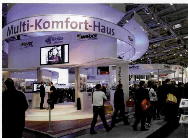
NA TARGACH „BAU” MIAŁA MIEJSCE PREZENTACJA PROJEKTU GRUPY SAINT-GOBAIN – MULTI-KOMFORT-HAUS, W KTÓREJ ZASTOSOWANIE ZNALEZŁY PRODUKTY WSZYSTKICH MAREK OFEROWANYCH PRZEZ KONCERN. MULTI-KOMFORT-HAUS TO IDEALNY BUDYNEK PRZYSZŁOŚCI, SPEŁNIAJĄCY WYMOGI M.IN. DOMU PASYWNEGO, ALE DOSTOSOWANY DO INDYWIDUALNYCH POTRZEB JEGO UŻYTKOWNIKÓW.